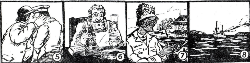
5 També es diu que si la secta hi té una part molt directa...