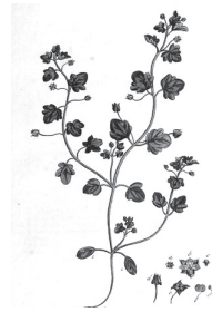
Verònica heurifòlia excés de matèria orgànica carbonada amb tendència a esdevenir fòssil