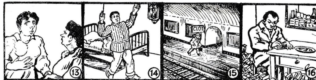
13 I pel letge? La carabata; un ho conta i mai acaba.