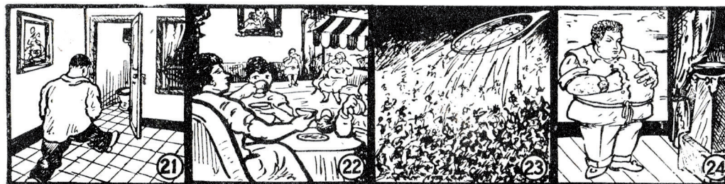
21 té una acció clara i directa especialment sobre el recte.