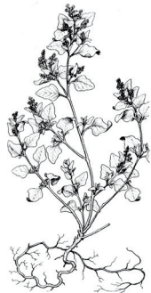
Blet pudent excés de potassi (K)