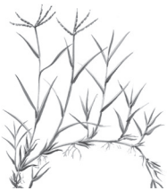
Gram En zona mediterrània, greu compactació del sòl i pèrdua d'humus