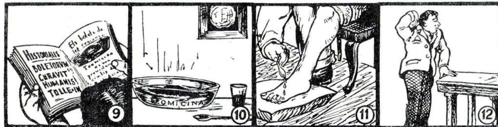
9 I ací comença la història d'aquest bolet ple de glòria.