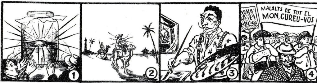
1 Un bolet de forma estranya fa furor a tot Espanya.